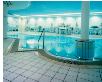
PCI Durafug NT zum Verfugen von keramischen Belägen mit erhöhter mechanischer Belastung und Beanspruchung, z. B. in Schwimmbädern.